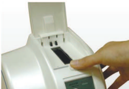
1) Откройте Анализатор CLOVER A1c.