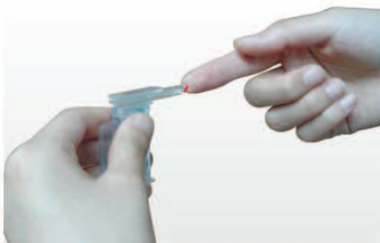
3) Встряхните пакет с реагентом 5-6 раз и поместите образец крови в Область образца.