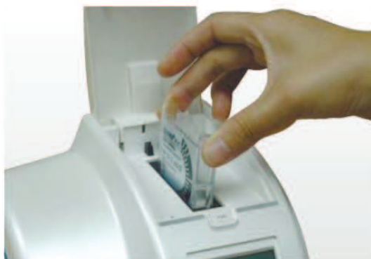
2) Вставьте Картридж.