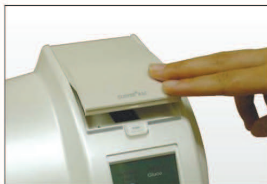
5) Закройте крышку Анализатора.