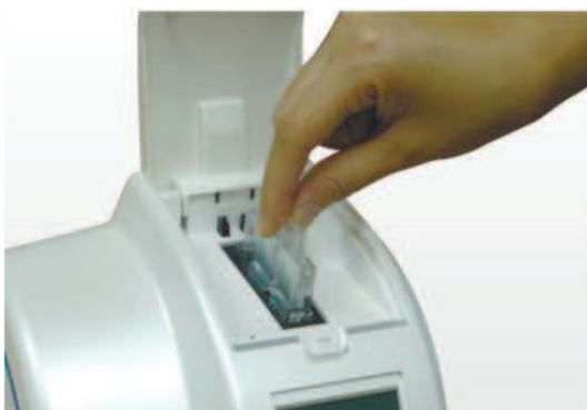
4) Вставьте Пакет с реагентом в Картридж в Анализаторе.